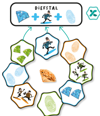
bv. 1 dief + 2 vingerafdrukken + 3 diamanten

Nu controleren en bevestigen alle spelers of de diefstal correct is. Als de speler gelijk heeft, krijgt hij de 3 kaarten die de diefstal creëren en legt hij deze open voor zich op een winstapel.